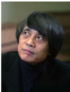
安藤 忠雄氏 建築家 東京大学名誉教授